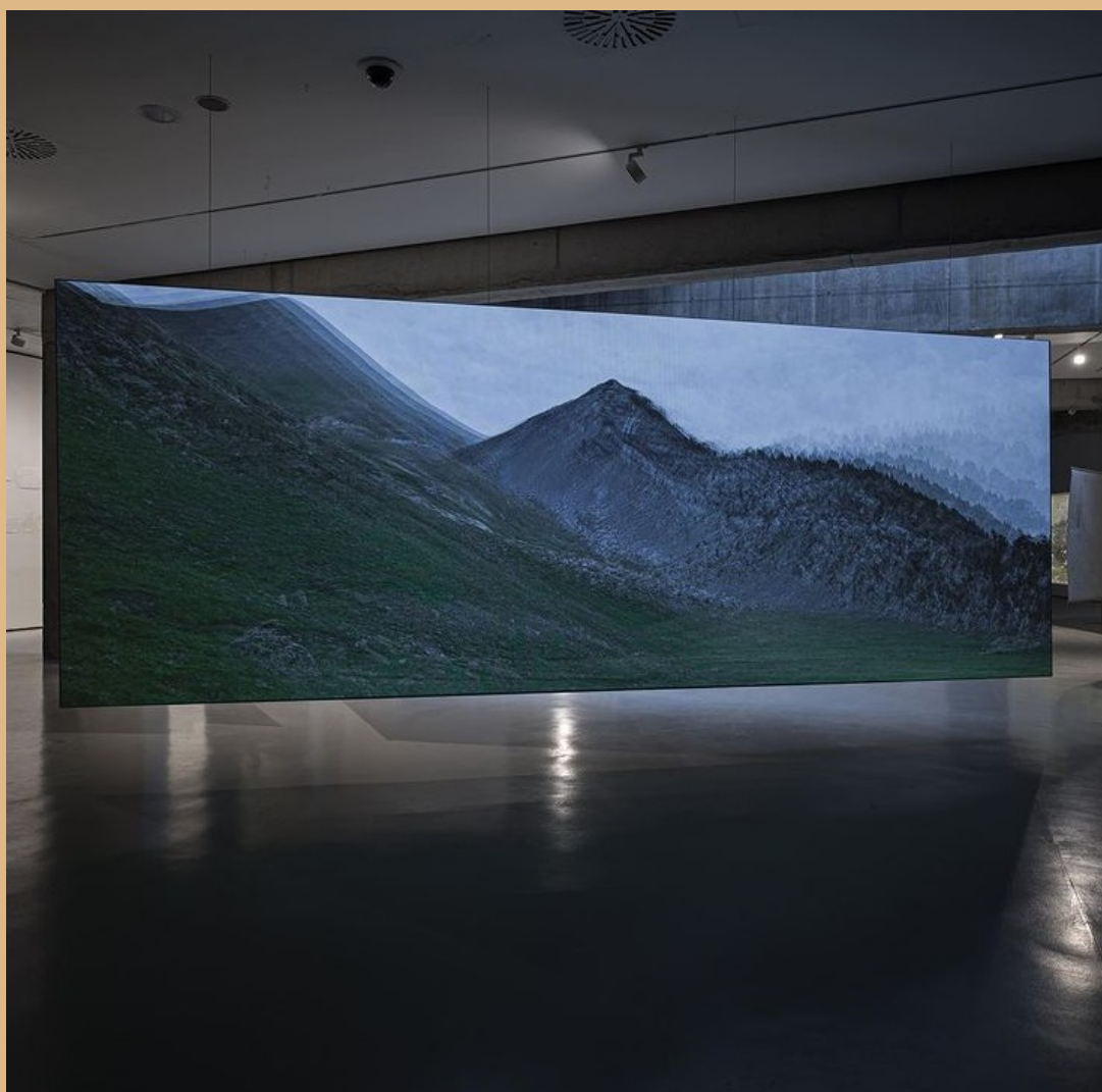
imagem da exposição "Num único acorde"

Aconselhamento para aquisição de obras de arte | Consulting for art acquisitions