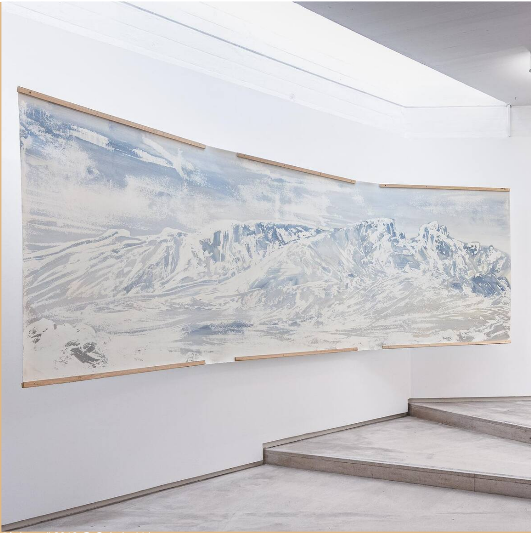
"Azimute" 2018 @ Galeria 111