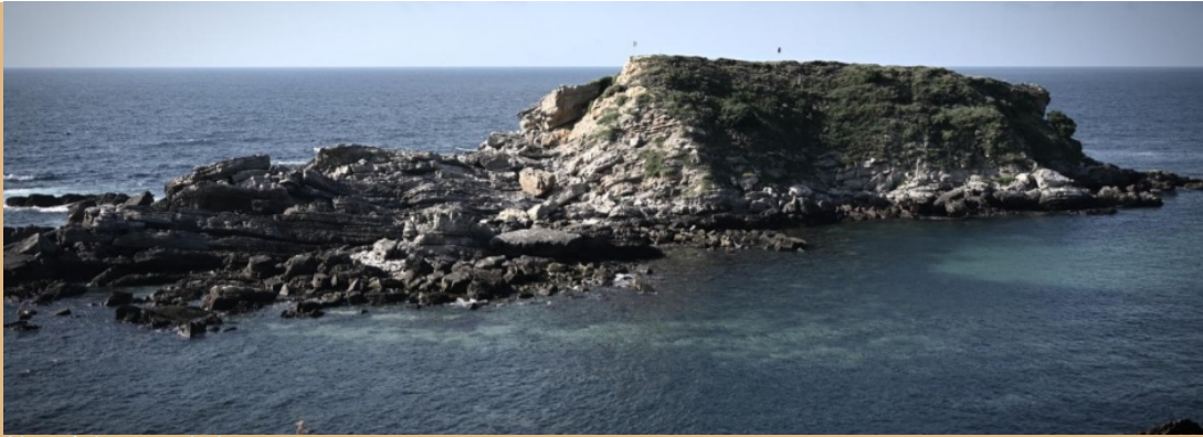
Num único acorde I