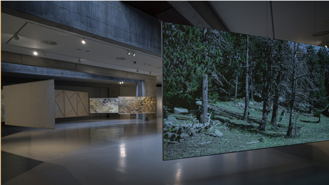
Imagem da exposição "Num único acorde"