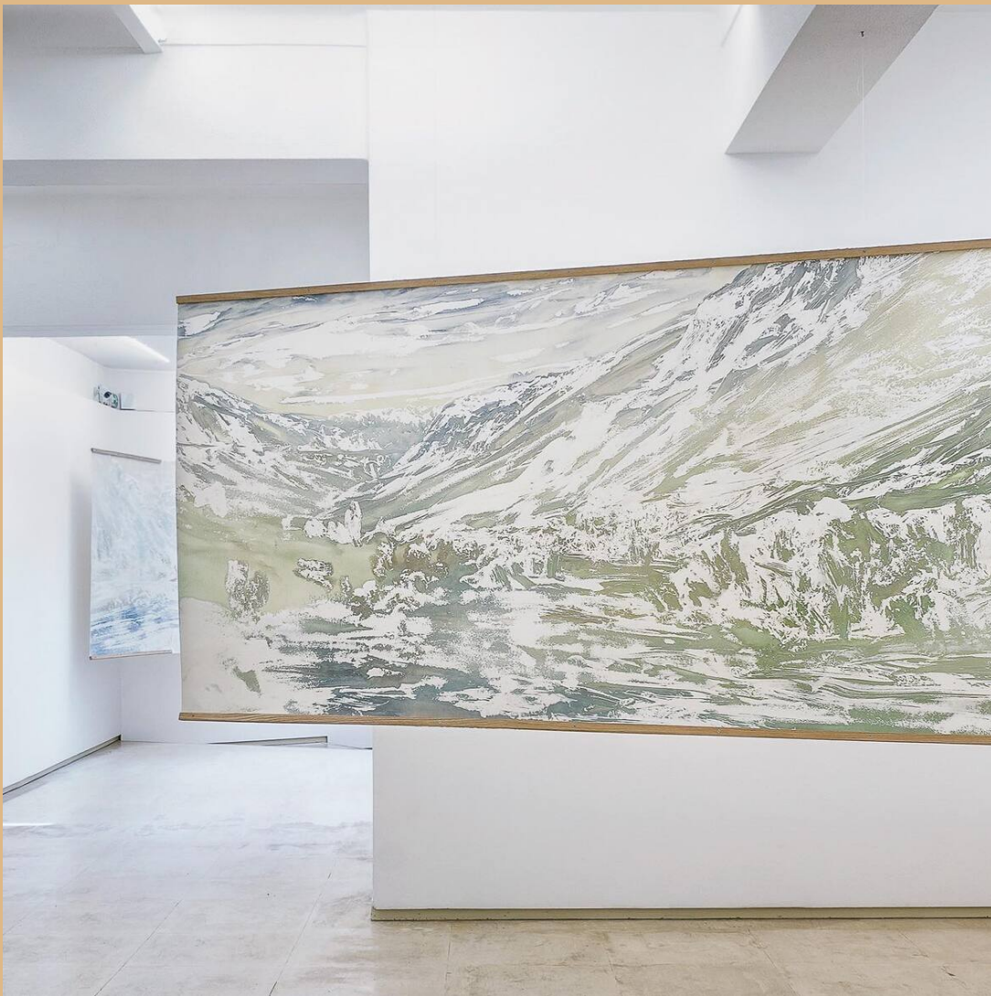
"Azimute", 2018 @ Galeria 111